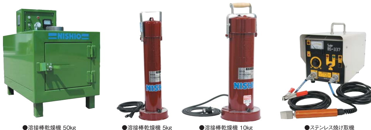
●溶接棒乾燥機 50kg ●溶接棒乾燥機 5kg ●溶接棒乾燥機 10kg ●ステンレス焼け取機