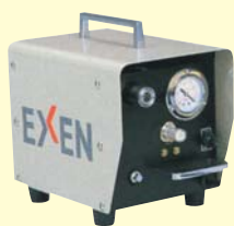
100Vバキュームポンプ