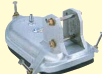
ヒューム管用バキュームパッド