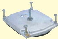
バキュームパッド