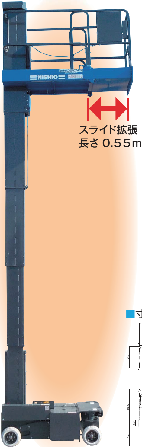
スライド拡張 長さ 0.55m