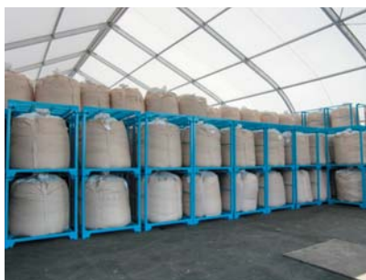
●廃棄物保管とラックによる効率化