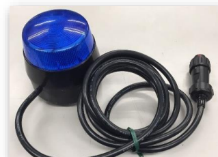
警告フラッシュライト（オプション品）