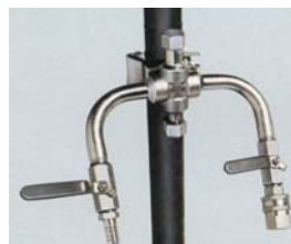
●ジャンクションバルブ