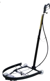
●カーシャシクリーナー